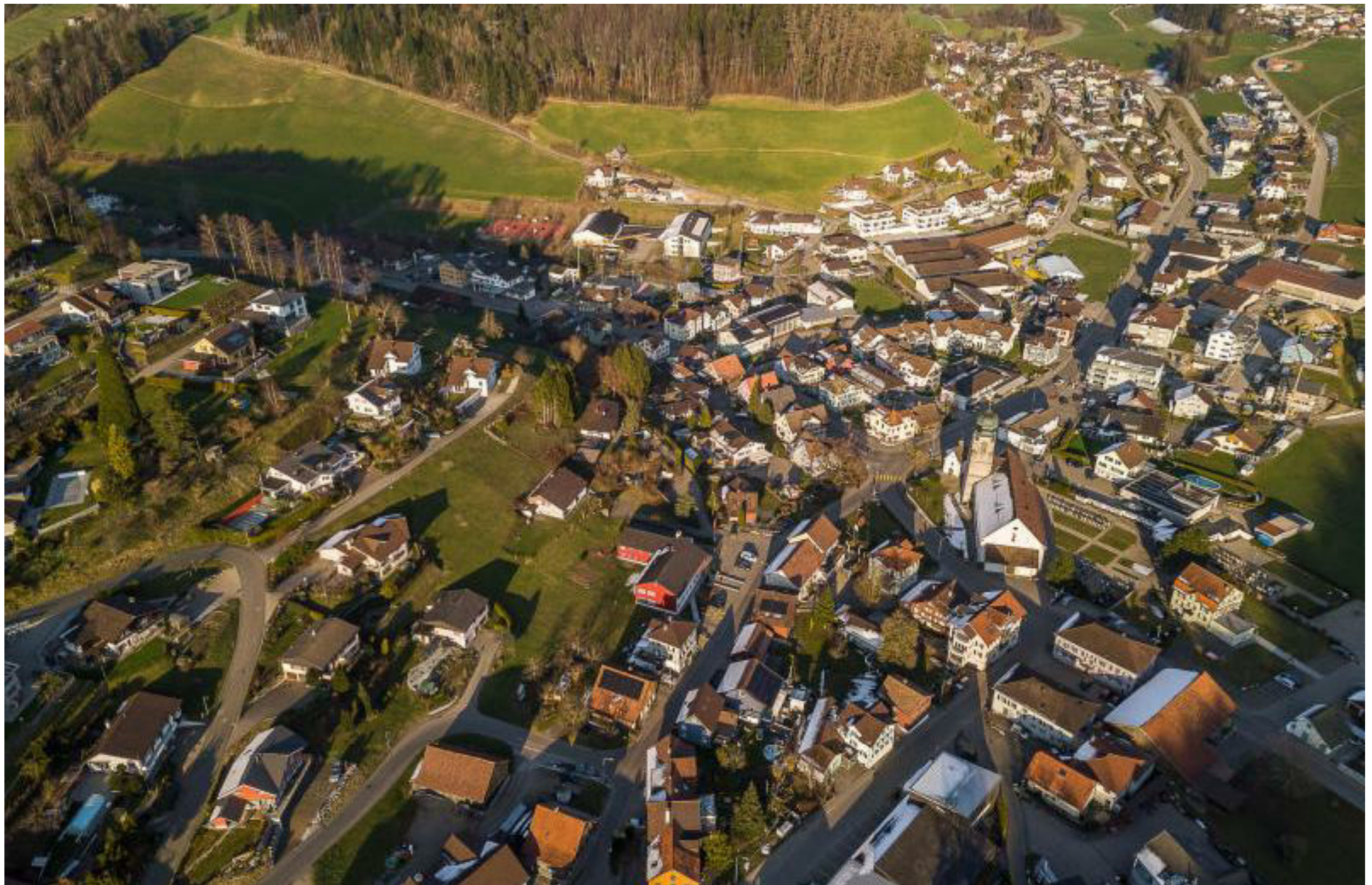
So präsentierte sich vor drei Wochen das Dorf Mosnang aus der Luft – der letzte Schnee wich inzwischen dem Frühlingswetter.